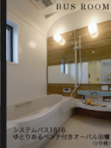
システムバス1616 ゆとりあるベンチ付きオーバル浴槽 (9号棟)