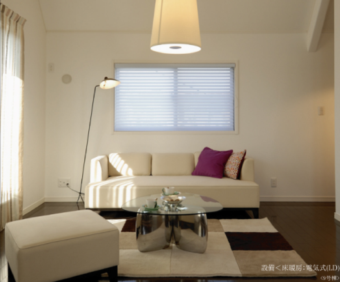
設備<床暖房:電気式(LD) (9号棟)