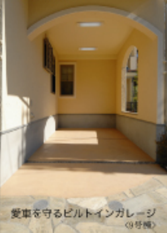
愛車を守るビルトインガレージ (9号棟)