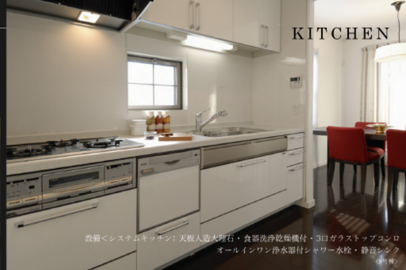
設備<システムキッチン:天板人造大理石・食器洗浄乾燥機付・3口ガラストップコンロ オールインワン浄水器付シャワー水栓・静音シンク (9号棟)