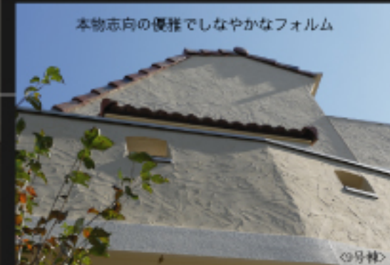
本物志向の優雅でしなやかなフォルム