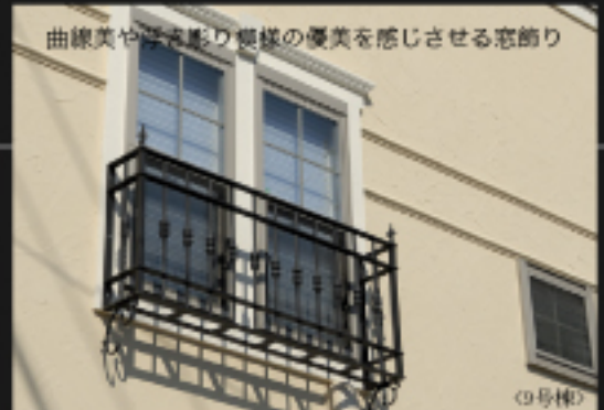
曲線美や光の影の優美を感じさせる窓飾り